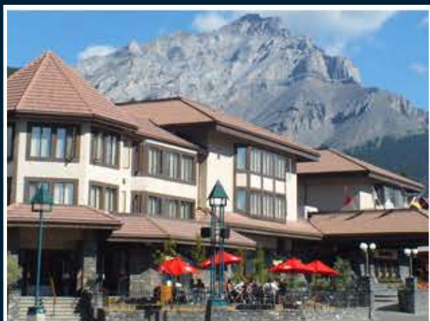
다운타운에 위치한 엘크 애비뉴 호텔