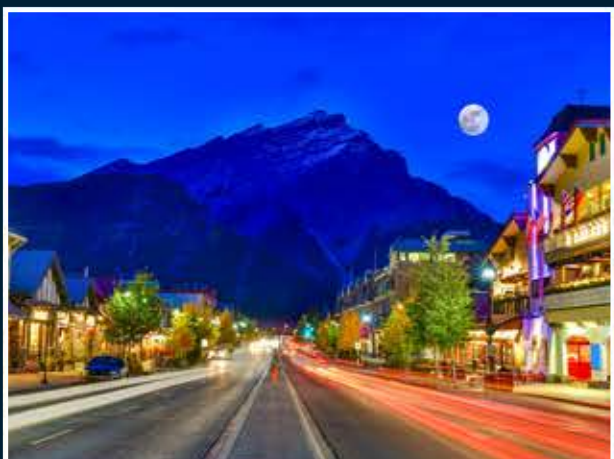
밴프 다운타운 야경

* 호텔은 상황에 따라 사전 고지 없이 동급의 다른 호텔로 변경될 수 있습니다.