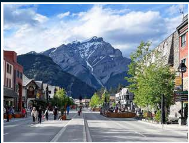
장엄한 록기산이 둘러싼 밴프 다운타운